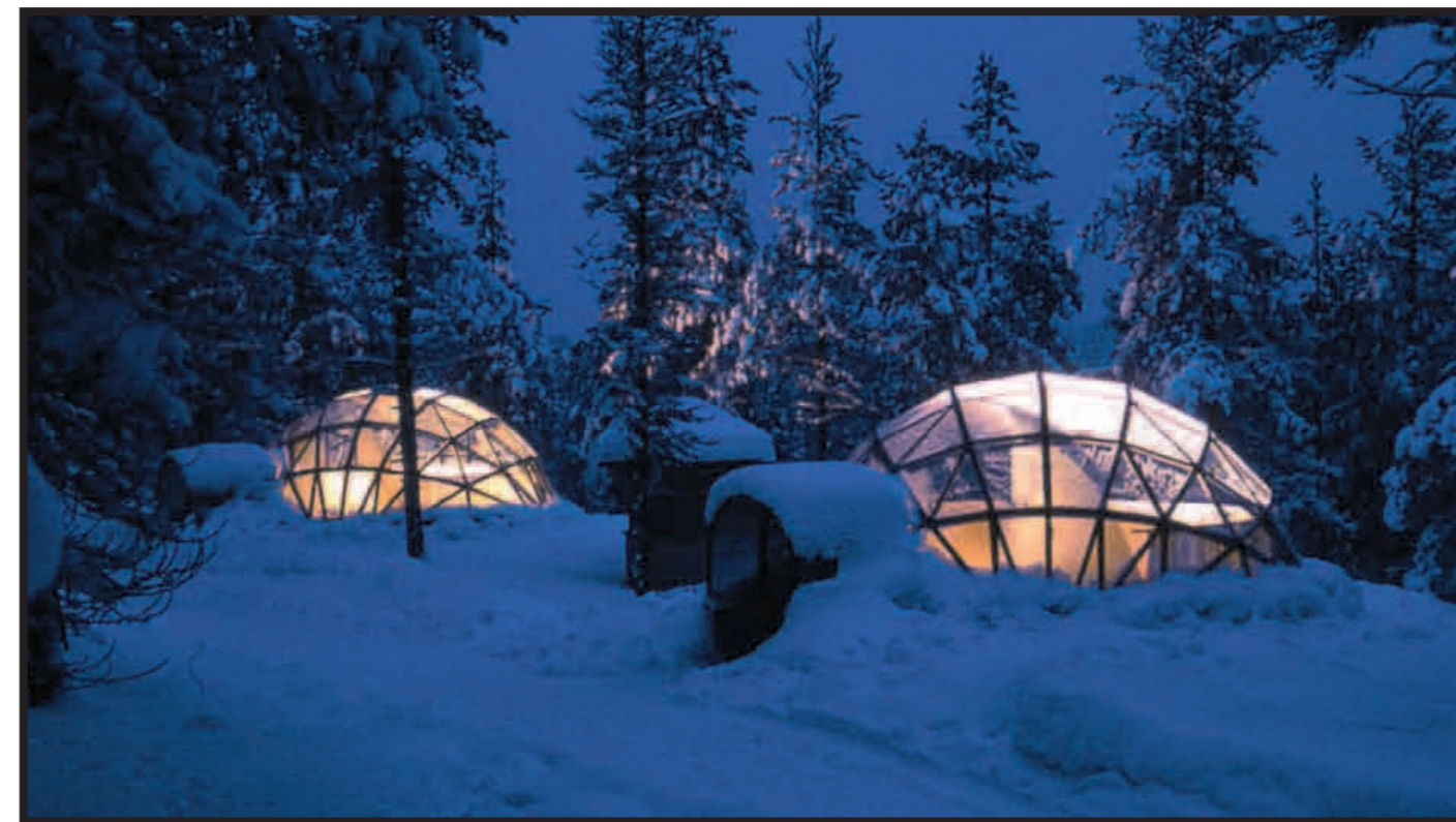
LES IGLOOS DE VERRE DE L'IGLOO VILLAGE, KAKSLAUTTANEN, FINLANDE _ DE GLAZEN IGLO'S VAN IGLOO VILLAGE, KAKSLAUTTANEN, FINLAND _ DIE GLÄSERNEN IGLOS IM IGLOO VILLAGE, KAKSLAUTTANEN, FINNLAND _ GLASS IGLOOS IN THE IGLOO VILLAGE, KAKSLAUTTANEN, FINLAND

FEESTELIJKE TRADITIES IN WALLONIË Journalist en fotograaf Charles Henneghien analyseert de nog erg levendige folkloristische tradities in Brussel en Wallonië aan de hand van volksfeesten. Een vrolijk en kleurrijk erfgoed! Fêtes et traditions populaires en Wallonie et à Bruxelles (Frans), door Charles Henneghien, uitgeverij La Renaissance du Livre. WWW.LARENAISSANCEDULIVRE.BE