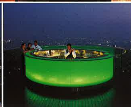
Sirocco At State Tower, Bangkok, Thailand

Clubs op extreme locaties, bars met experimentele concepten, restaurants met een baanbrekend interieur, hotels vol verrassend entertainment of architecturale wonderen van feestzalen: stuk voor stuk hebben deze zaken als doel hun bezoekers een unieke ervaring mee te geven. Extreme Locations toont 's