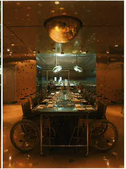
Aurum At The Clinic, Singapore

bijwerkingen. Restaurant Aurum betreed je via een verborgen deur achter een rij lijkenlades in het 'lijkenhuisje', de ontvangstruimte met inox interieur en glazen façade. De zaak, die eind 2006 haar deuren opende, is van vloer tot plafond goud geschilderd en versierd met glanzende stippen. De gasten mogen plaatsnemen in gouden rolstoelen aan klinisch geboende operatietafels met speciale lades voor servetten en bestek. Van hieruit heb je een ongehinderd zicht op de roestvrijstalen keuken, waar gerechten worden bereid volgens de wetten van de moleculaire gastronomie.