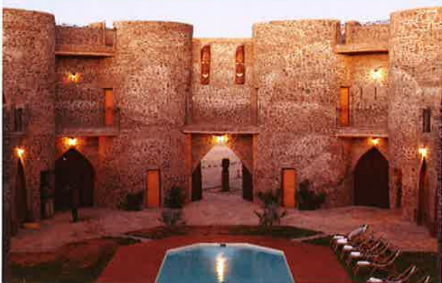
© Le Mirage Desert Lodge & Spa, Namibië

uit van de omgeving. Geïnspireerd door de Marokkaanse architectuur en ontworpen volgens de aloude vormen van een Afrikaanse rondavel, zorgt het voor de verkoeling die broodnodig is in dit extreme klimaat. De 27 luxueuze suites bieden een spectaculair uitzicht over de woestijn, de bogen en pilaren creëren een mysterieuze sfeer, de groene binnentuin en het zwembad zorgen voor verstrooiing en het wellness center voor de ultieme ontspanning. Wil je desondanks toch nog actief zijn, dan kan je met een quad door de woestijn scheuren, de nabijgelegen Sossusvlei bezoeken of een memorabele ballonvaart maken.