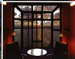
De Havenkraan Van Harlingen, Nederland