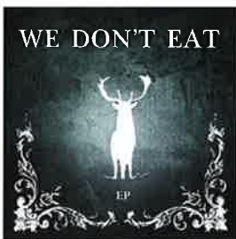
JAMES VINCENT MCMORROW WE DON'T EAT EP

'We Don't Eat EP' is een verzameling van tracks die gaan over liefde en verlangens. Het is een mix van covers en live versies van nummers op zijn debuutalbum 'Early In The Morning'. De Ierse zanger heeft het afgelopen jaar een groot publiek weten te raken met zijn akoestische gitaar en doordringende stem. Ook op festivals was hij een daverend succes en dit bleef niet onopgemerkt. Begin dit jaar ontving hij de European Border Breaker Award.