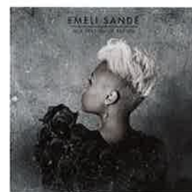
EMELI SANDÉ - OUR VERSION OF EVENTS

Met haar fraaie ballads verovert deze schotse zangeres land voor land, mooie plekken in vele hitlijsten. Haar prachtige, zuivere voice werd in september 2011 beloond met een award in de categorie Critics Choice tijdens de Brit Awards. Hiermee kreeg Emeli de titel voor meest talentvolle nieuwe artiest. Door haar krachtige stemgeluid verwerkt in de rustige R&B en soulgeoriënteerde sounds, wordt emotie op een prachtige wijze naar voren gebracht.