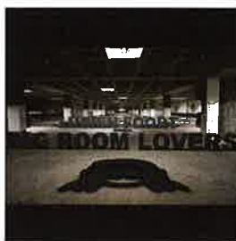
LUCIEN FOORT - BIG ROOM LOVERS

De cd Big Room Lovers is afgeleid van het dance event dat internationaal dj en producer Lucien Foort organiseert. 'De Big Room sound' is dan ook het geluid dat je hoort op de mainstages van alle festivals; groots, meeslepend en bombastisch. Met de internationaal klinkende tracks van bekende dj's zoals Ferry Corsten, Tristan Garner, Mossy en natuurlijk Lucien Foort zelf, is deze sound duidelijk hoorbaar.