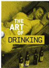
THE ART OF DRINKING

In the Art of Drinking wordt op een kunstzinnige wijze het genot van drank benadrukt. Stijlvolle, oude foto's, mooie advertenties van vroeger en expressieve quotes maken dit boek zeer aantrekkelijk. Vele bekende zangers, acteurs en ware stijliconen zijn met een drankje in beeld gebracht. Denk aan onder andere Keith Richard, Frank Sinatra en Dita Von Teese.