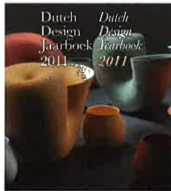
DUTCH DESIGN JAARBOEK 2011

In het Dutch Design Jaarboek 2011 worden de beste Nederlandse ontwerpen op het gebied van ruimtelijke vormgeving, productvormgeving en communicatie in kaart gebracht. Aan het designjaar 2011 wordt kleur gegeven door middel van een selectie belangrijke evenementen, publicaties en tentoonstellingen. Naast deze huidige ontwikkelingen word je als lezer meegenomen naar de toekomst van design.