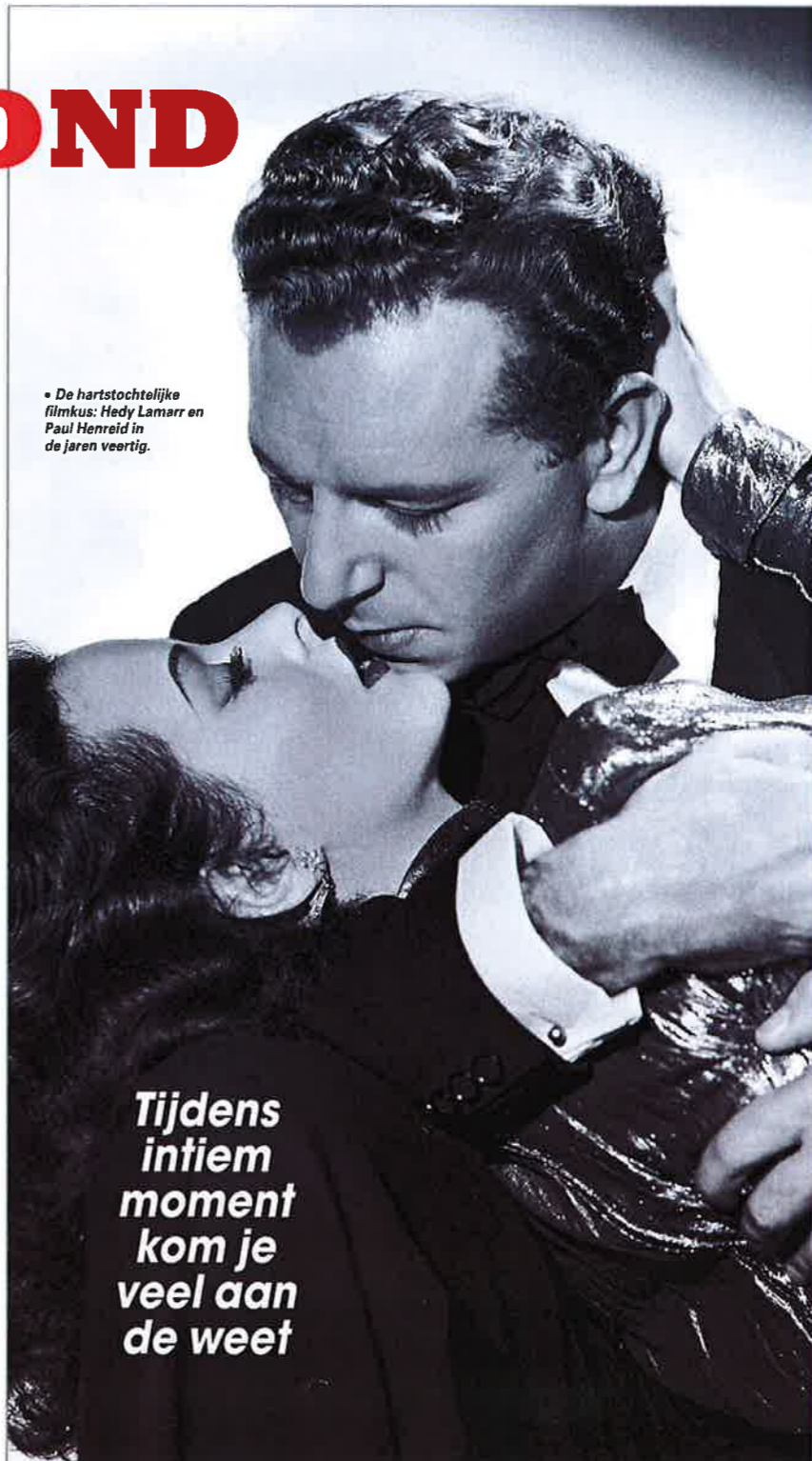
• De hartstochtelijke filmkus: Hedy Lamarr en Paul Henreid in de jaren veertig.

Nog zo'n fijn trucje van de natuur: op het moment dat je het 't meest nodig hebt - wanneer je dicht bij elkaar bent dan ooit - zwellen je lippen op, verstraakt je huid en krijg je een rozige kleur. Ook je pupillen worden wijder; de reden waarom we tijdens een gepassioneerde kus onze ogen sluit-