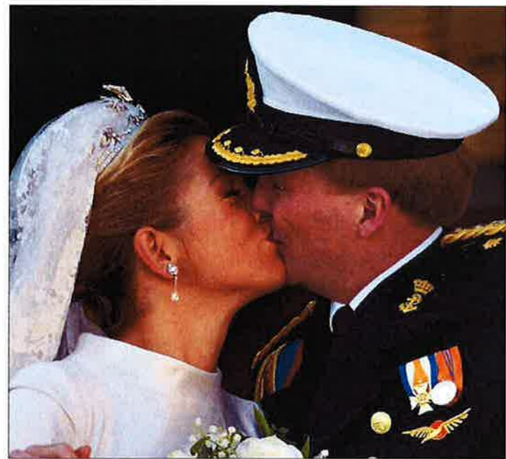
• De kus waarop heel Nederland wachtte: Willem-Alexander en Máxima op het bordes na hun huwelijk.